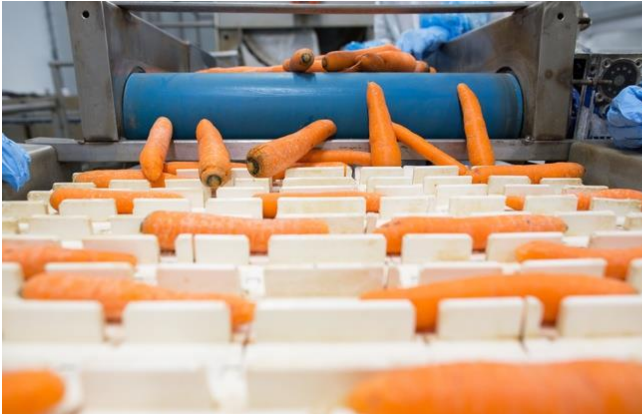
Une première légumerie de produits issus de l'agriculture bio et conventionnelle a ouvert en Ile-de-France (Illustration).